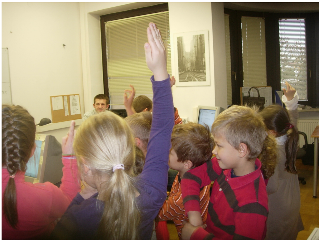
Ryc.4 Dzieci aktywnie uczestniczą w wizycie w siedzibie firmy.