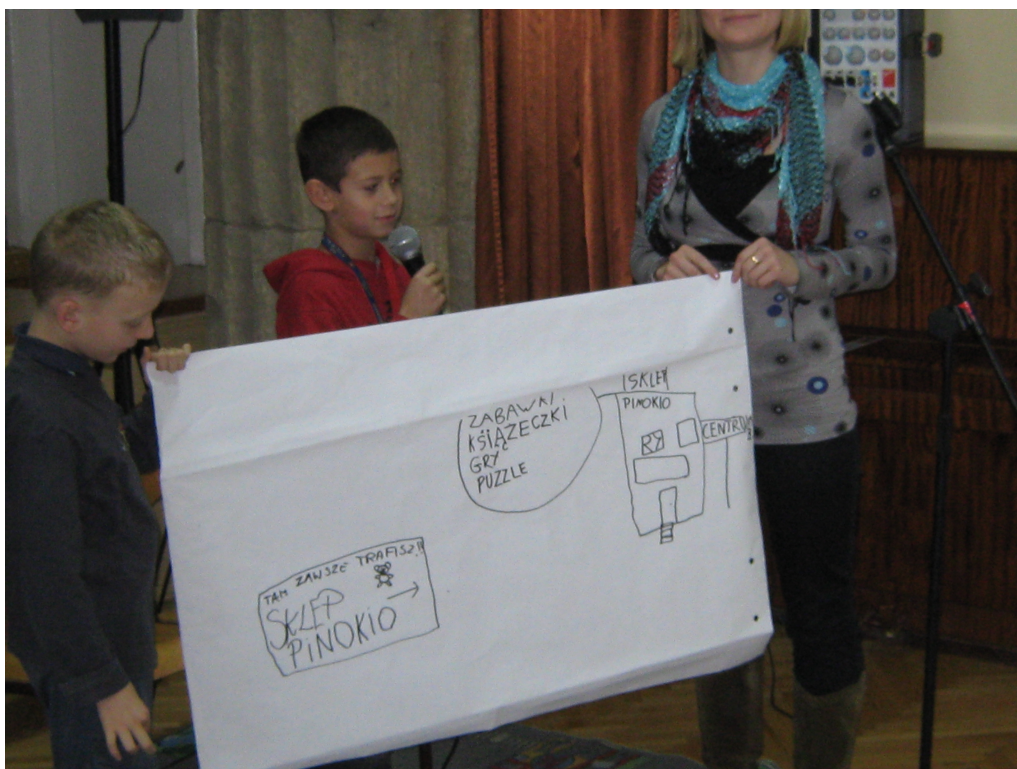
Ryc.5 Warsztaty przedsiębiorczości prowadzone przez wolontariuszy w krakowskiej szkole podstawowej.

Istnieją krajowe i lokalne organizacje, które chcą i mogą pomóc szkołom w realizacji projektów dotyczących przedsiębiorczości. Nie potrzeba wiele, aby rozpocząć taki projekt. Mamy wsparcie. Możemy korzystać z doświadczenia innych. Podjęcie pierwszego kroku zależy od uczniów, nauczycieli i rodziców.